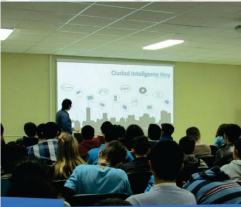
"Ciudades inteligentes hoy"