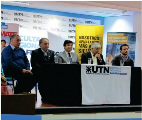
ACTO DE INAUGURACIÓN